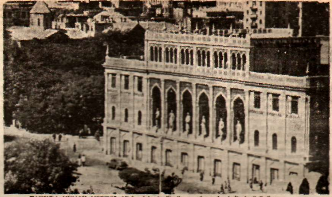
BAKU'DA NIZAMI MUZESİ: Nispet için de ölmüş ozanların heykelleri görünüyor.