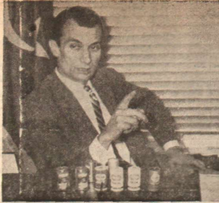
Ziya Hepbir Turuş ve pehrizli..

Yabancı petrol şirketleri çalışanların işletmenin içinde bir insan olarak, o işletmeyi yürüten ve çalıştıran bir organ olarak hiç bir söz hakkına sahip olmasını istememektedirler. Yani işçiler ve serdikalar, işyerlerinde o işletmede uygulanacak çalışma metotları, işçinin işe alınması ve çıkarılması gibi işçi için son derece hayati ve önemli konularda tek başlarına söz sahibi olmak istefindedirler. Yerli petrol endüstrisi ise, çalışanların da birer insan olarak çalıştıkları işyerinin düzenli çalış-